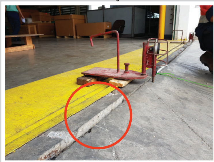
ภาพก่อนฉีดสารยูรีเทค เรซิน